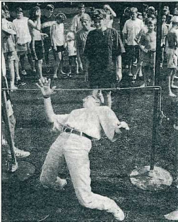
Menige Tjerkwerder bewoog zich zaterdagmiddag lenig onder het touw door bij het limbodansen.