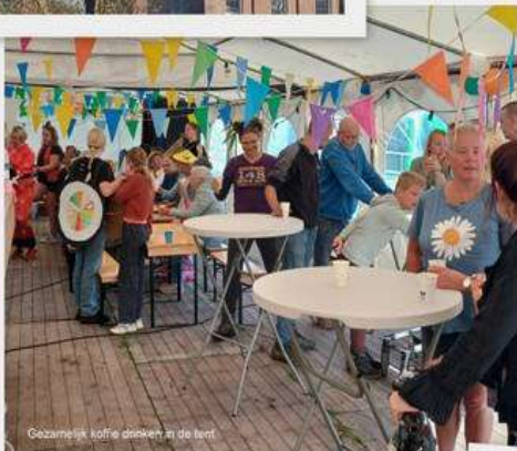
Gezamenlik koffie drinken in de tent