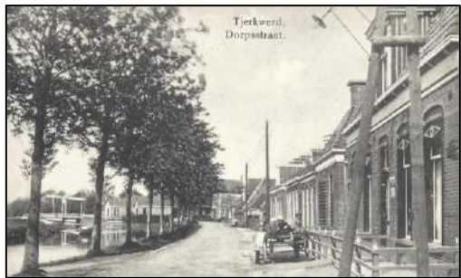
Op Nûmer 21 wenne eartiids de famylje Baarda.