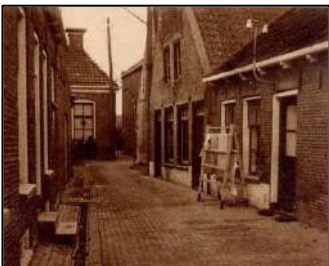
Links de bakkerij fan De Jong en rjochts de winkel fan Draaijer.

gezellig in de fietsmakerij. Kosten één kwartje per beurt. De winnaar van één sjoel – of balgooironde kreeg een waardebou. Deze kon je dan inleveren in de fietswinkel/galanteriezaak van Draaijer. Ik leverde zo ook mijn waardebouwen in en heb zo leren wanten en of ook wel eens een zaklamp ervoor kunnen krijgen.